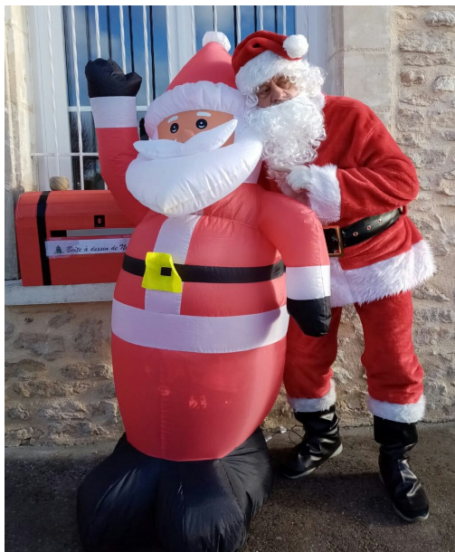
Le Père Noël câline son effigie

Là encore cette animation n'a pu se tenir, en raison des conditions sanitaires. Cependant, le CCAS a souhaité faire une distribution singulière des colis des anciens.