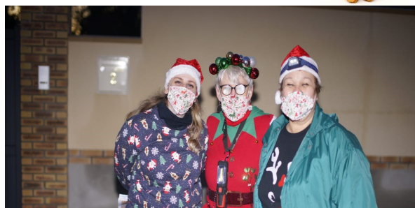
La bonne humeur règne !