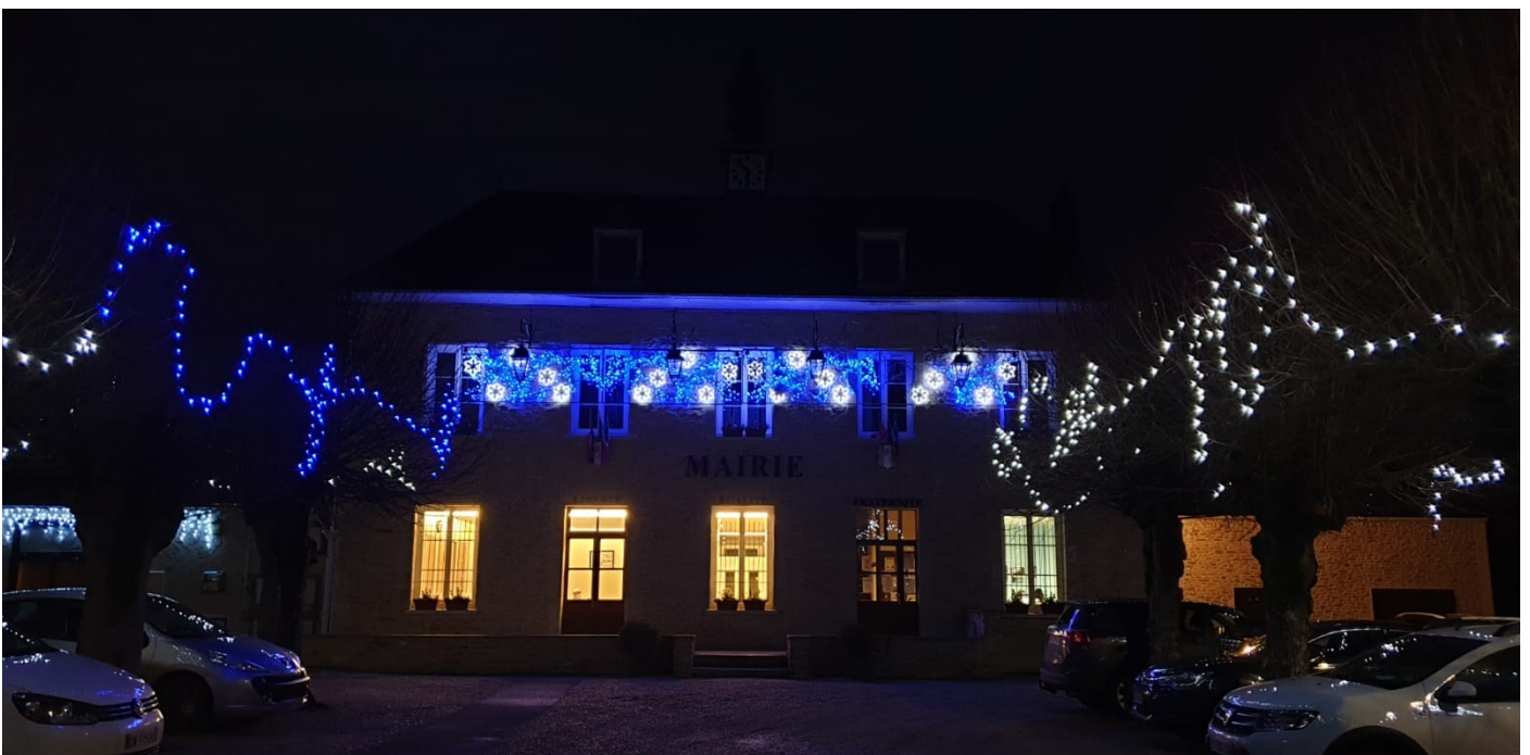
La mairie illuminée

Beaucoup d'entre vous sont déçus de ne pas voir d'illuminations dans leur rue.