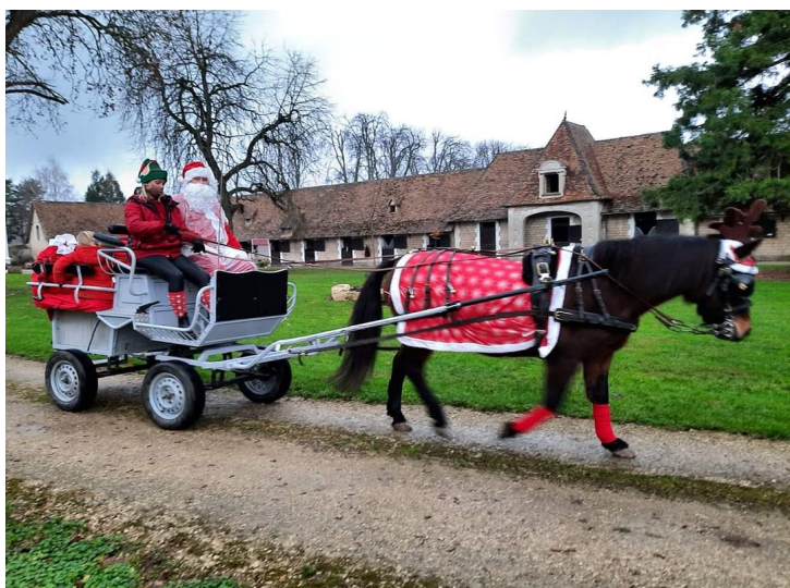
Le Père Noël part pour sa tournée !