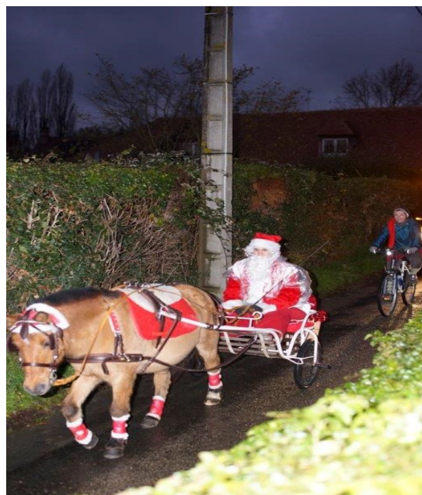
La nuit tombe, rien n'arrête le Père Noël