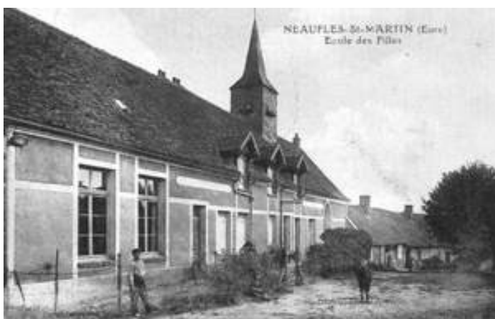
Transformation en école pour filles

A ce jour ce bâtiment de caractère regroupe deux logements et 2 salles communales utilisées par diverses associations.