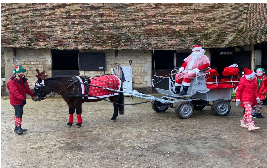
Le Père Noël et ses lutins se préparent pour la distribution