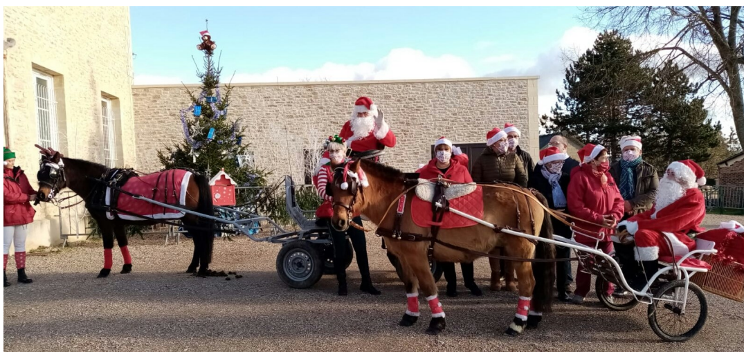
Une partie des membres du CCAS prête à aider à la distribution