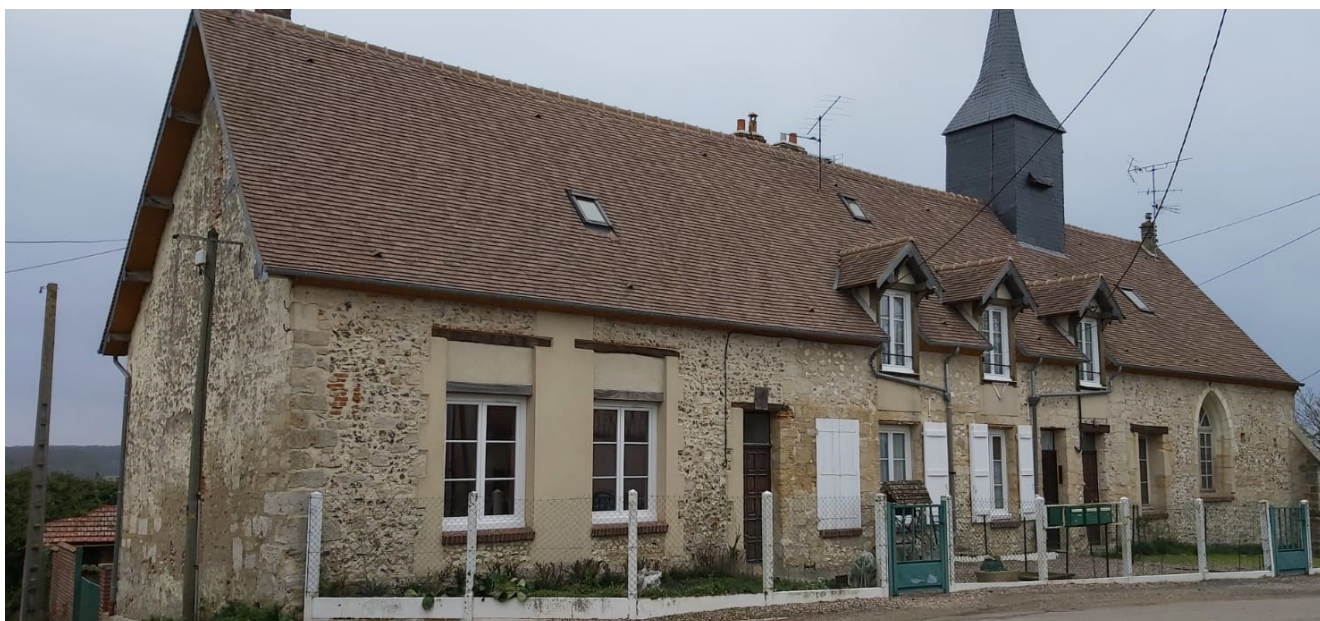
L'église Saint-Pierre actuellement