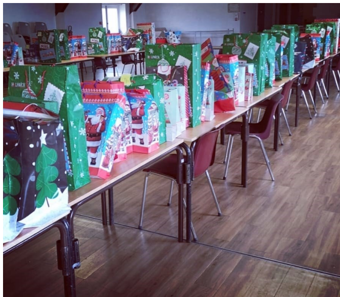
Les cadeaux prêts à être distribués par le Père Noël