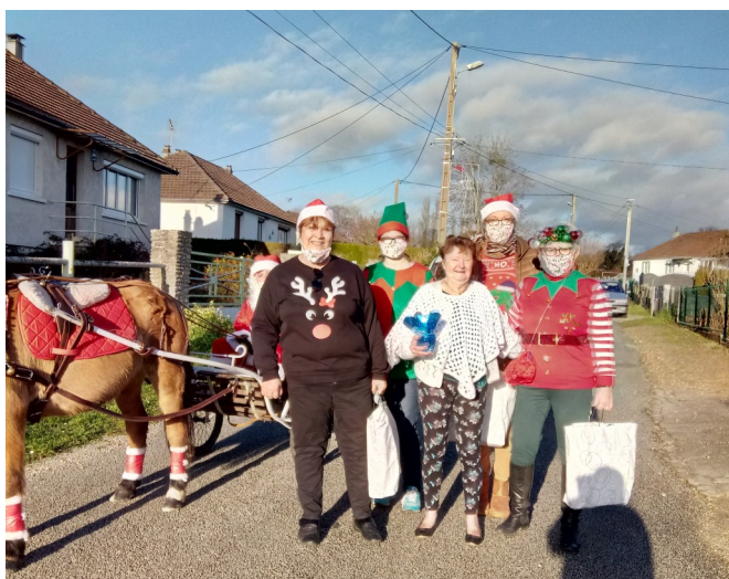
La distribution se déroule dans la joie et la bonne humeur pour le grand plaisir des bénéficiaires

La satisfaction a été immédiatement perçue et nous en sommes ravis.